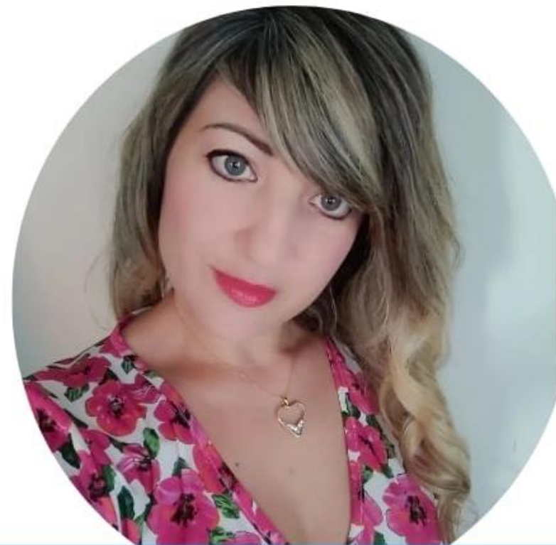
Vanessa Acri Scuola Primaria

Voglio una scuola ove integrazione e inclusione non siano solo belle parole sulla carta ma qualcosa di reale e concreto. Voglio che i docenti si sentano motivati nel loro lavoro perché adeguatamente riconosciuto nella sua dignità e adeguatamente remunerato. Voglio docenti con la voglia di portare i bambini in gita perché lo Stato gli riconosce la trasferta e li tutela giuridicamente. Voglio una scuola che abbia ambienti idonei all'apprendimento e con i giusti strumenti e non tanti fondi investiti male a causa dei troppi vincoli imposti. Insieme possiamo! Scegli NoiScuola Bene Comune.