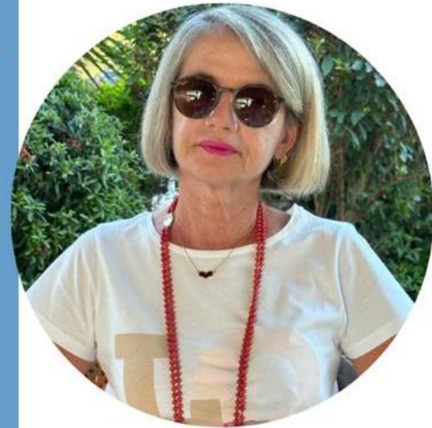
Michela Acconci Scuola Primaria

Ecco il perché della mia candidatura e la scelta di questo Sindacato che ha fatto proprie le lotte per una SCUOLA DEMOCRATICA, LIBERA che sappia dare dignità' alla professione degli insegnanti e che passi anche da una " giusta" riqualificazione economica.