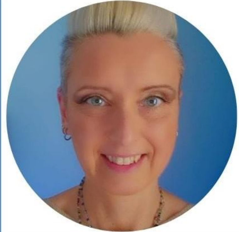
MARTA ERODIANI SCUOLA PRIMARIA

Sono fermamente convinta che la scuola sia un luogo di crescita fondamentale per gli studenti e che il benessere di tutti i componenti della comunità scolastica sia un prerequisito per il successo formativo. Per questo, se eletta al CSPI, mi impegnerò con tenacia e passione a rappresentare gli interessi di tutti, lavorando per un sistema scolastico sempre più inclusivo, equo ed efficiente."