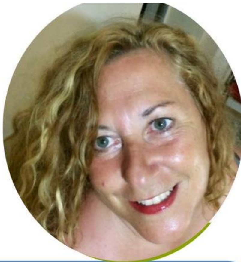
EMILIA MEZZATESTA SCUOLA PRIMARIA

Ho accettato di candidarmi in questa lista perché credo nelle cose umili, ho sempre lottato per il riscatto sociale e la dignità della persona, promuovendone la crescita personale e sociale. Conosco il mondo della scuola paritaria, della scuola pubblica e della cooperazione sociale. Ogni giorno della mia vita dal 1990 l'ho vissuto educando, empatizzando con alunni, colleghi, famiglie, associazioni. Ritengo che la nostra presenza nel mondo del sindacato dei "Grandi" possa fare la differenza. Se sei sfiduciato/a e non ti senti ascoltato/a sappi che tanti docenti sono nella tua stessa condizione. Fai un passo di fiducia, aiutaci a riappropriarci della dignità del ruolo, ormai perso nel tempo.