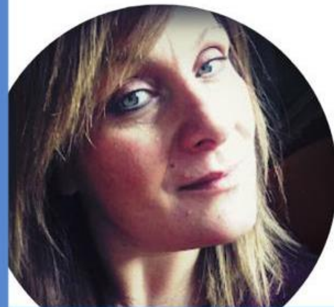
NADIA TAVELLA SCUOLA SECONDARIA DI PRIMO GRADO

Il nostro scopo come lista sarà quello di portare una fotografia attendibile della realtà, e rappresentare al meglio tutto il comparto scuola. Bisogna ridare dignità alla figura docente perché siamo i primi agenti di inclusione sociale ed educativa.